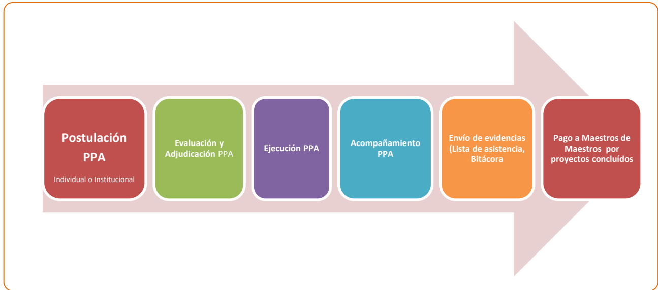
Diagrama de implementación Proyecto de Participación Activa