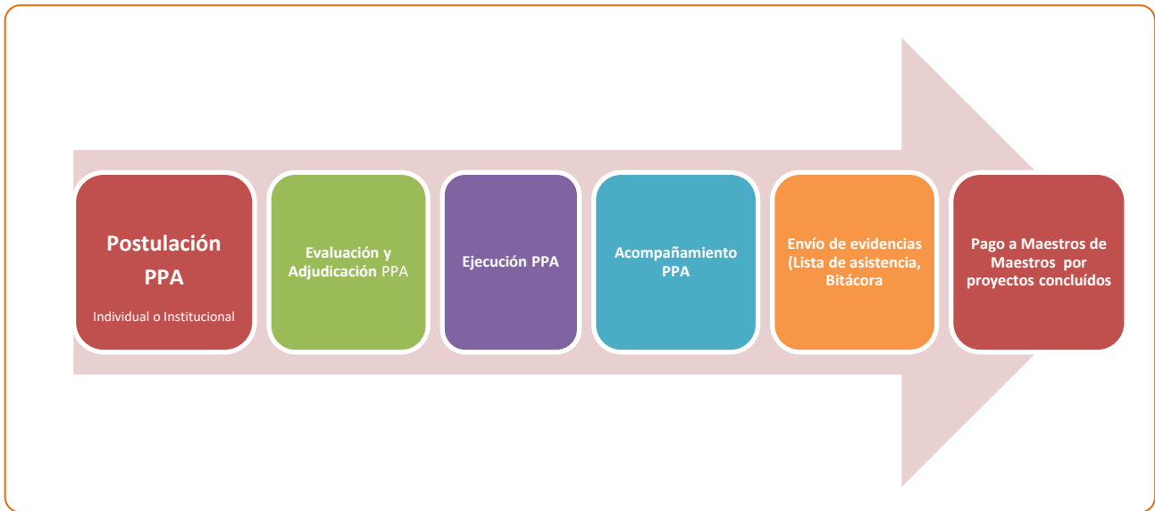
Diagrama de implementación Proyecto de Participación Activa