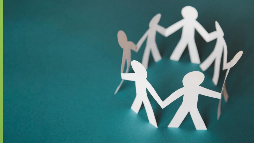
Figura 1: Trabajo colaborativo