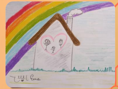
Trabajo en familia