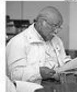
SE REALIZARÁN TALLERES.