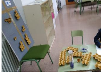
Figura 1: Entrevista individual y materiales utilizados

Para que los alumnos observasen el cambio, se introducían en la máquina piedras lunares y, dentro de la máquina, la investigadora le añadía dos piedras lunares. Pedíamos a los alumnos que explicaran lo que observaban y que representaran en una tabla la información obtenida, para ello utilizamos el franelograma con columnas y encabezados y hueveras. Así, emergieron parejas de datos. Por ejemplo, entra una piedra y salen 3 piedras. Utilizamos números menores que 10, por ser con los que estaban familiarizados y se les plantearon en orden no consecutivo para evitar la recurrencia. Por último, dimos a los alumnos un folio para que describieran qué pasó en la sesión.