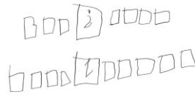
Figura 2: Entrevista A1

pedras que entraban a la izquierda, el cambio lo representó con una interrogación en un cuadrado y a la derecha los elementos que salían de la caja (ver figura 2).