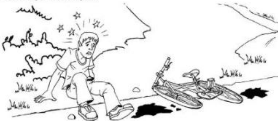
Fuente: Baradetti, M., "Datos para el viaje", La muerte y otras sorpresas , Alfaguara, Madrid, 1965.